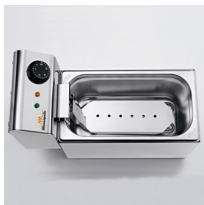
Protezione antiurto resistenze