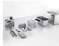
Facile da smontare e pulire