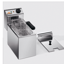
Posizione di sgocciolo