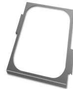
Flangia per estrazione vasca olio - opzionale