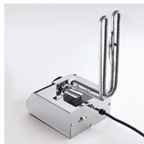
Bulbo termostato/Pulsante di ripristino cut-off